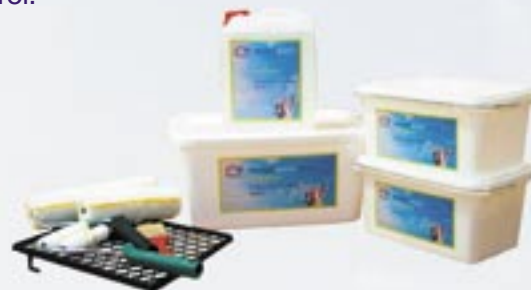
Homeset für ca. 12 qm.

Das atmungsaktive, diffusionsoffene Finish garantiert die Wirkungsweise der unteren beiden Schichten. Seine Gitternetzstruktur verleiht Protect Room® Stabilität. Das ästhetisch ansprechende Finish wirkt abweisend gegen Schimmel und Pilze. Das System Protect Room® ist vollkommen schadstoff-frei.