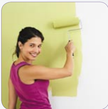
Die Verarbeitung ist „kinder“ leicht.